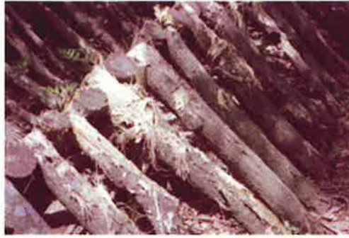
写真3 (左) : ヒノキ造林木の剥皮被害 (長崎県壱岐市)