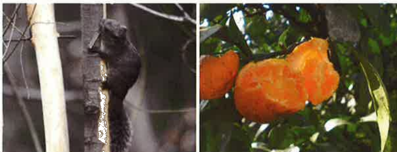
写真1 (左) : 樹皮を削り 樹液をなめる (神奈川県) 写真2 (右) : 食害を受けた 柑橘類 (神奈川県)

浜松市北側山塊は他県にもつながる中部東海地方の豊かな自然環境の宝庫です。外国産リス類は短期間で爆発的に個体数が増加して分布域も拡大し、森林生態系への多大な影響が懸念されます。また、一度連続的な山塊に侵入してしまうと、駆除対策は大がかりな規模になることが予想されます。